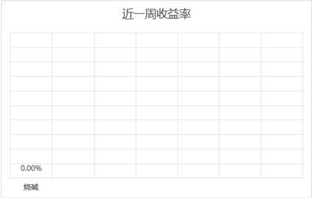
图表2：交易品种近一周收益率（百分比）