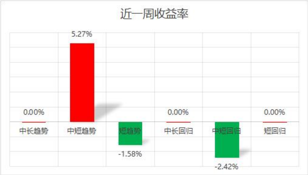
图表1：子策略近一周收益率（百分比）