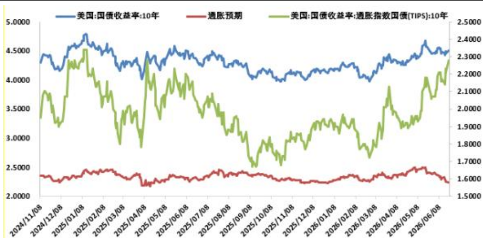
图：美债实际利率持续走高